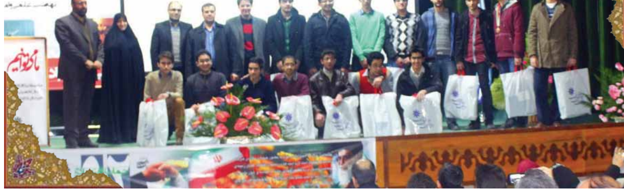
صدای تشویق حضار لحظه به لحظه بیشتر می شود و در ادامه، برگزیدگان مقام های کشوری خوارزمی مورد تشویق قرار می گیرند.