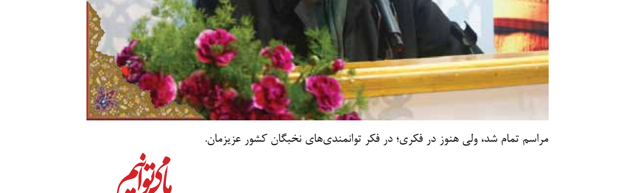
مراسم تمام شد، ولی هنوز در فکری؛ در فکر توانمندی های نخبگان کشور عزیزمان.