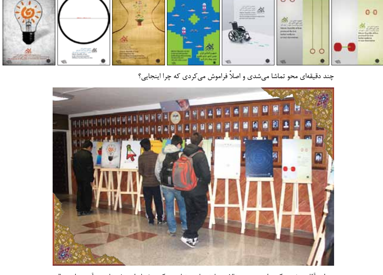
چند دقیقه ای محو تماشا می شدی و اصلاً فراموش می کردی که چرا اینجا ایستادی؟

از در ورودی دبیرستان علامه حلی که وارد می شدی، ناگهان تابلوهایی که بر روی بوم نقاشی به طرز خاصی چیده شده بودند، جلب توجه می کرد. تابلوهایی که با عنوان «ما ما توایم» مزین شده بود و هر کدام از آنها سخن از آخرین دستاوردهای علمی کشور بود که ایران عزیز را در زمره ده کشور برتر جهان در آن زمینه علمی نشان می داد.