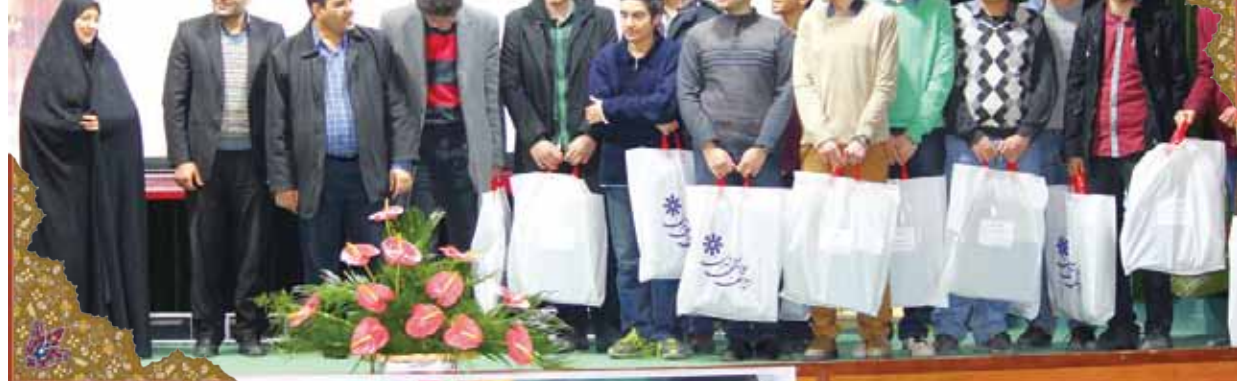
پس از آن، کلیپ کوتاهی در رابطه با فعالیت های پژوهشی مرکز می شود و بلافاصله از ۱۷ نفر از افتخار آفرینان عرصه پژوهش دبیرستان برای اهداء جوایز شایسته دعوت به عمل می آید.

برگزیدگان قرآنی، اولین گروه از دانش آموزانی هستند که مورد تقدیر قرار می گیرند. ۷ نفر از حافظان آن قاریان قرآن کریم که توانستند در سال تحصیلی ۹۲-۹۱ افتخار آفرینی کنند، مورد تشویق حضار قرار می گیرند و جوایز خود را دریافت می کنند.