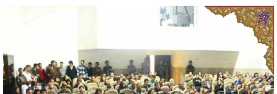
صدای آقای مؤذبی که برای ورود به تالار همایش ها دعوتتان می کرد، شما را به خودتان می آورد. وارد سالن همایش می شوید. تقریباً دیگر جای نشستن نیست.